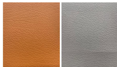
- material image -