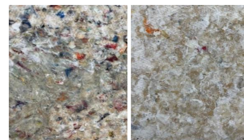
- material image -