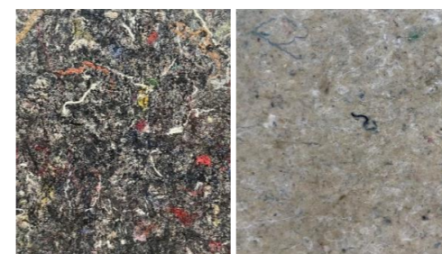
- material image -